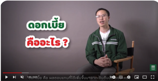
จากเว็บไซต์ YouTube ช่อง HengLeasing ดอกเบี้ยยสำคัญใจ คิดก่อนอย่างไร | เสง ราม ธิง EP.6